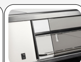
Porte scorrevoli posteriori